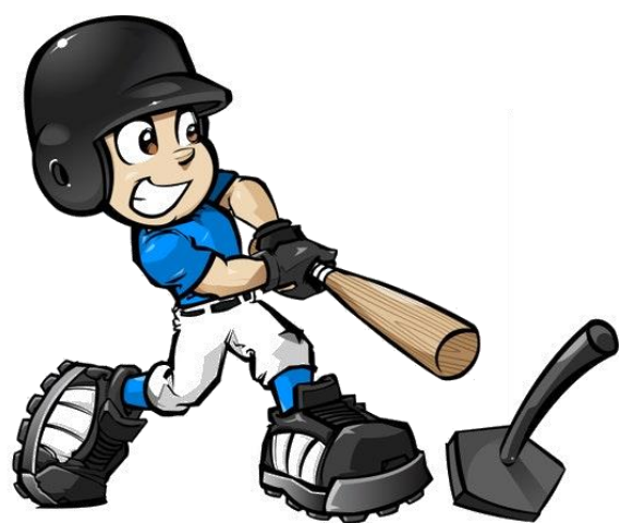
＼ 準備体操～ ＼

試合は2イニングで3試合おこなわれ、珍プレイ・好プレイのなか、みんな楽しくティーボールに汗を流しました。